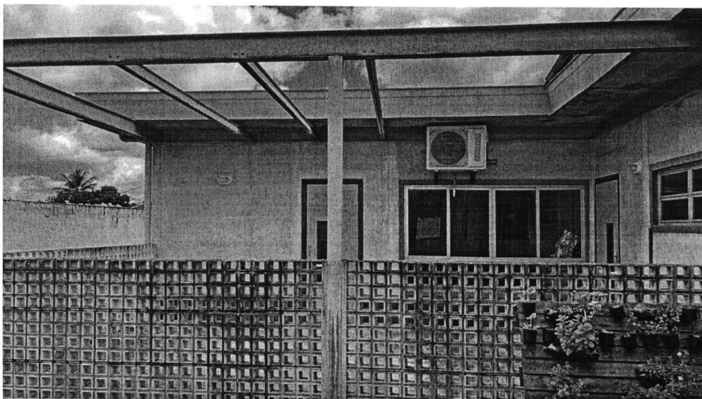
Imagem 01: Registro realizado em visita ao local.