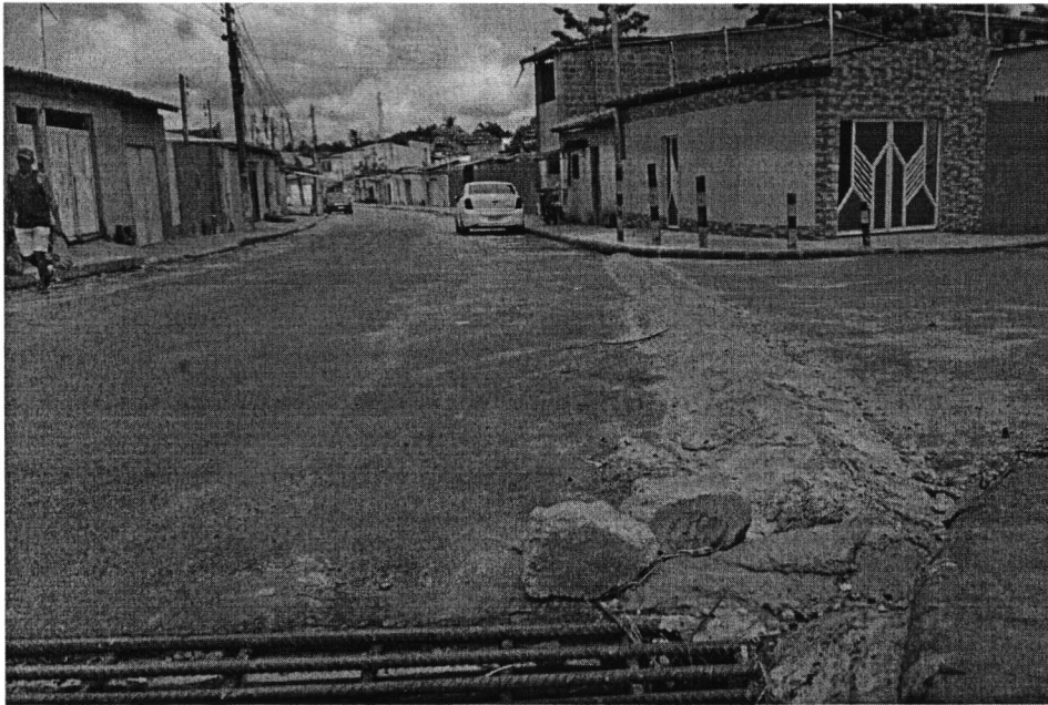
Imagem 01: Registro realizado em visita ao local.