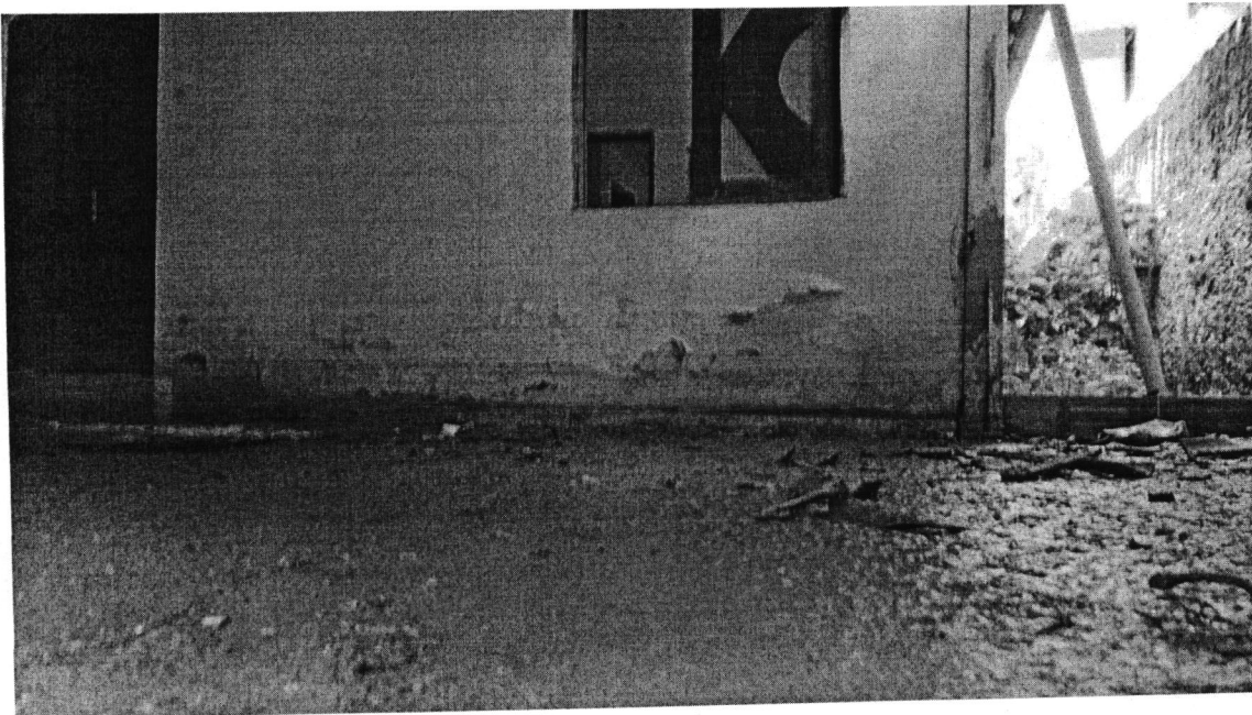
Imagem 04: Registro realizado em visita ao local.

Rua Philadelfo Neves, s/n, Juracy Magalhães, CEP: 48040-170, Alagoinhas-Bahia, Telefone: (75) 3182-3333, Whats App : (75) 99913-0070 www.camaradealagoinhas.ba.gov – lumamenezes@camaradealagoinhas.ba.gov.br