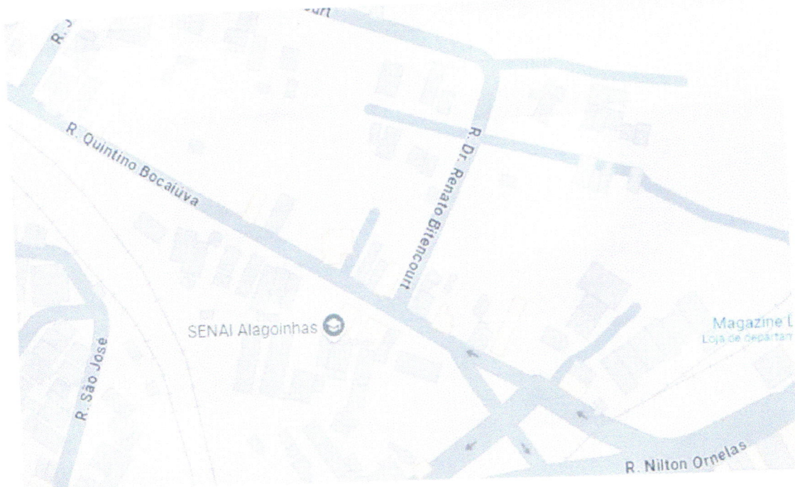
*Localização da Rua Dr. Renato Bitencourt.