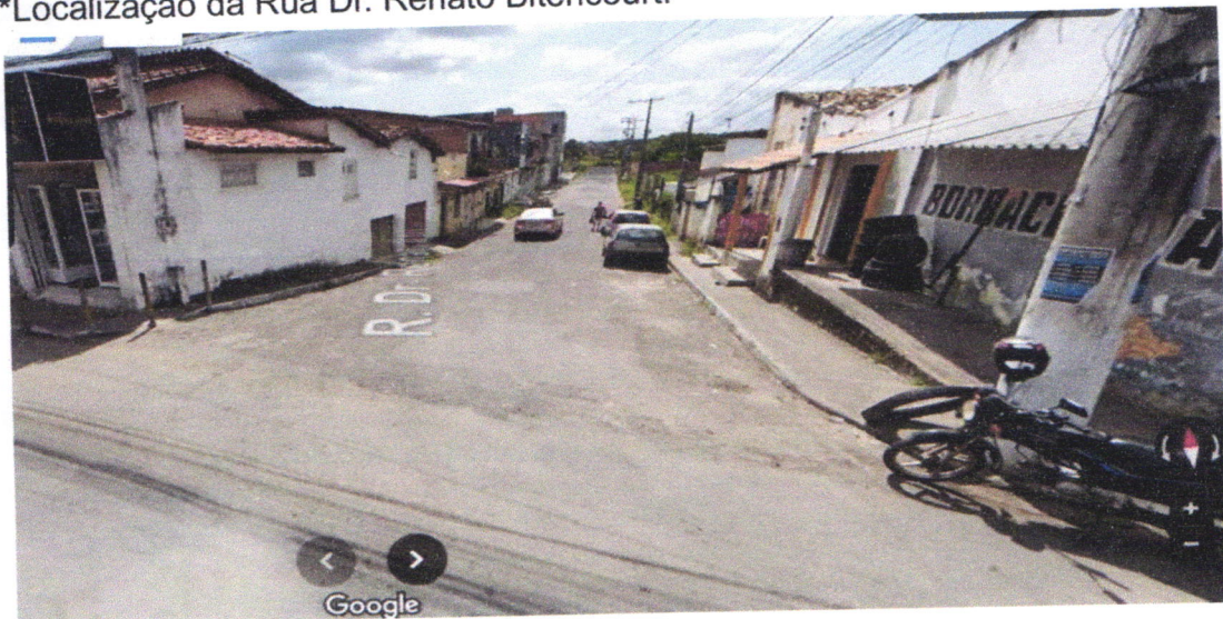
*Entrada da Rua Dr. Renato Bitencourt.