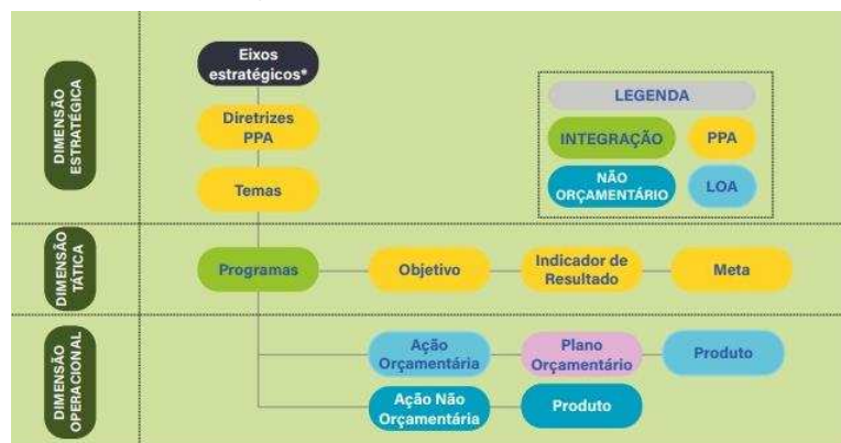
Figura 1: Modelo Referência do PPA Federal

Tais inovações estão voltadas para o resgate da função planejamento, para a utilização de uma linguagem capaz de melhorar a comunicação dentro e fora do Governo e para o fortalecimento da dimensão estratégica do Plano, criando as condições necessárias para a gestão e implementação das políticas públicas na perspectiva municipal.